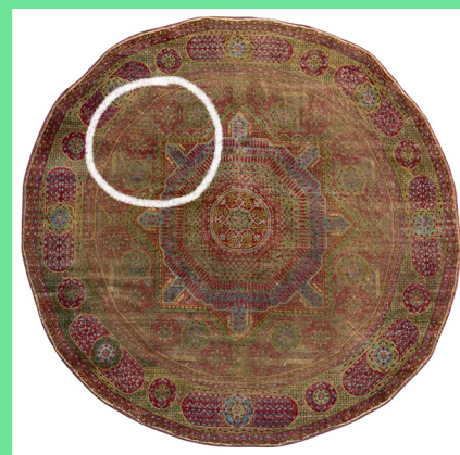
List stromu jinanu dvoulaločného (ginko biloby); stylizovaná kresba listu; mamlúcký koberec z Egypta, 1510–1520, materiál vlna, Arcidiecézní muzeum Kroměříž