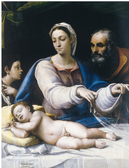
Sebastiano Luciani, zv. del Piombo, Madona s rouškou ; kolem 1520; olej, topolové dřevo

Jedná se o druhé zarámování obrazu. Ohraničuje kompozici a jeho barva má rovněž význam pro celé barevné vyznění díla. Především je to ale odhrnutá opona, která vám odhaluje děj odehrávající se před vašimi očima a zároveň vás jako pozorovatele od výjevu může oddělit. Pomocí tohoto jednoduchého prvku se malíř snažil docílit vyšší tajemnosti dění, zprostředkovat zážitek prchavé situace a tím vším podpořit zdání skutečnosti malované scény.