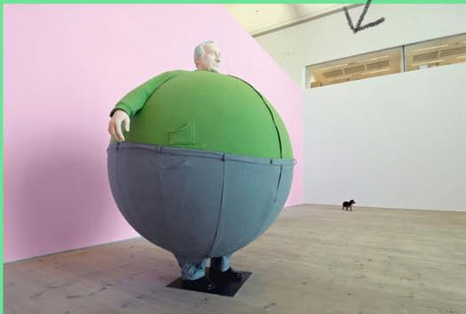
Erwin Wurm, Umělec, který spolkl svět , 2006

Jako takové pravítko reálných poměrů velikostí jednotlivých částí těla nám může posloužit výška hlavy. Všimněte si, že v průběhu toho, jak rosteme, se tyto poměry mění. Kolikrát se vejde výška mé hlavy do mého těla ve věku miminka, dvanáctiletého kluka a dospělého?