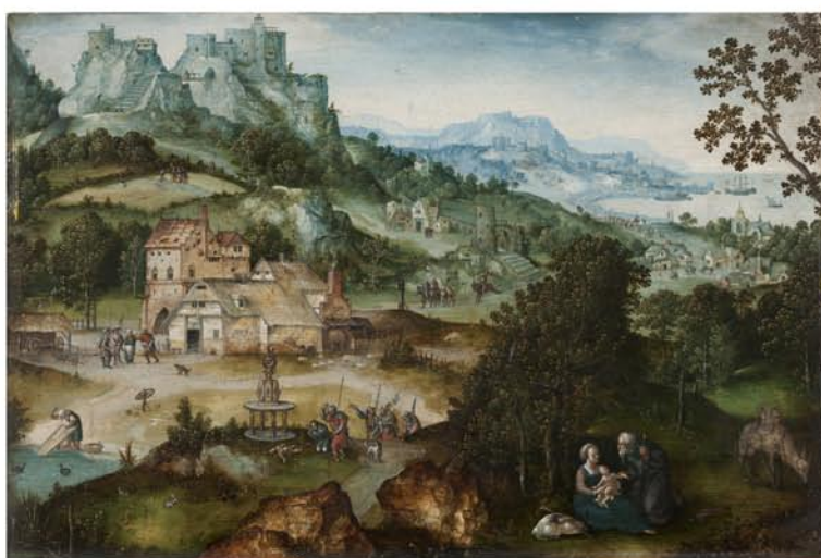
Lucas Gassel van Helmond (kolem 1488–1568/69), Odpočinek na útěku do Egypta , 1540–1450; olej na dubovém dřevě; Arcibiskupství olomoucké – Muzeum umění Olomouc

Odpočívající Svatá rodina, tedy malý Ježíš, jeho matka Marie a pěstoun Josef, jsou sice důležité postavy díla a nacházejí se v předním plánu obrazu, nicméně důležitou roli v něm hraje také obydlená krajina. Není to pouhý doplněk biblického či historického výjevu, jak bývalo zvykem ve středověké malbě, ale tento již renesanční umělec ji více přiblížil skutečnosti. Zobrazený děj přenesl z biblických časů do své současnosti, tedy první poloviny 16. století. Jednotlivé figury (stafáž) ve středním plánu obrazu jsou oděny podle tehdejší módy, na selském stavení vidíme dobové a místní architektonické prvky. Krajina má svou hloubku, iluze prostoru je docílena pomocí atmosférické perspektivy.