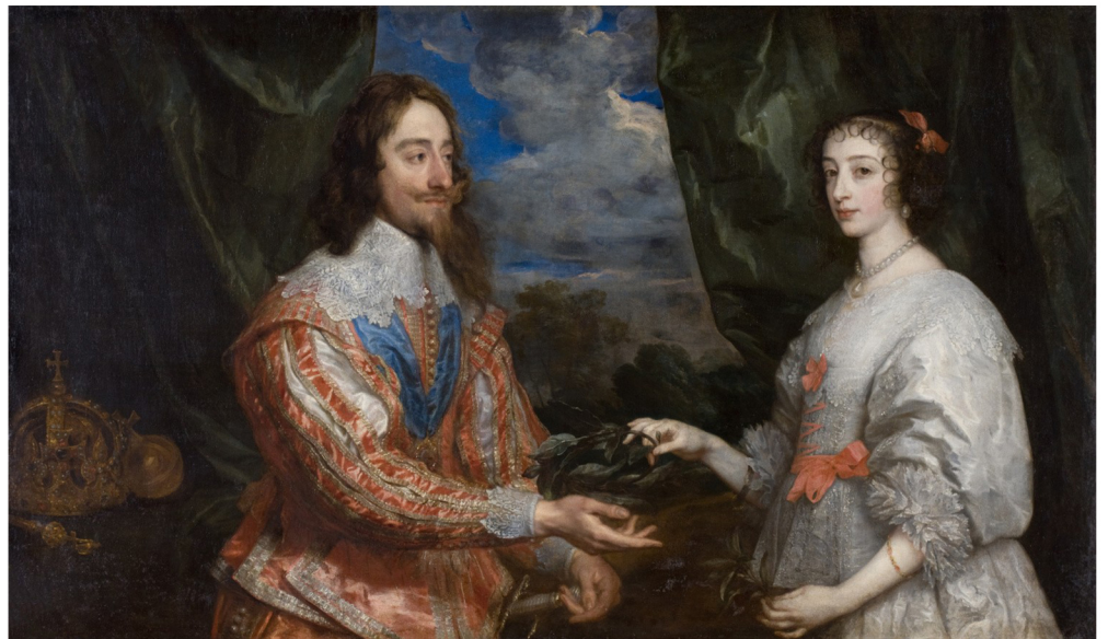
Anthonis van Dyck (1599–1641), Anglický král Karel I. a jeho manželka Henrietta Marie , mezi 1632–1634, olej, plátno; 104x176 cm, získáno 1673, Arcibiskupství olomoucké – Arcidiecézní muzeum Kroměříž

Tento obraz patří dle mého názoru mezi nejkrásnější příklady portrétního umění. Vyniká neobyčejnou životností zobrazeného královského páru, propracovaností oděvů a okolního prostředí. Vypovídající je také hra rukou obou manželů. Královna předává Karlovi vavřínový věnec, on jí naopak olivovou ratolest. Obojí můžeme chápat jako symbol míru a příslib manželské věrnosti. To potvrzují také výmluvné pohledy a gesta portrétovaných osob. Radostná zvěst manželské lásky, stejně jako usmíření dvou království je skrze odhrnuté závěsy zvěstována světu.