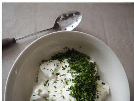
Jiří Víšek, Jídlo – 3 zátiší , 2020, fotografie

Inspirovat se můžete touto ukázkou. Autor na čisté ploše bez dekoru zachytil obyčejné jednoduché tvary zeleniny nebo nádobí a nějaký výrazný detail.